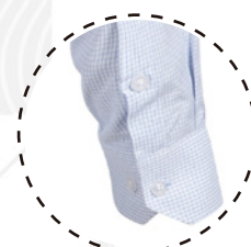
PUÑO DOBLE BOTÓN

T-WORLD , es ropa corporativa de alta calidad, diseñada con estilo único, acompañando a los trabajadores y empresas de todo Chile.