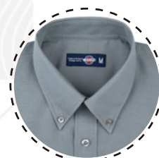
CUELLO BUTTON DOWN

T-WORLD , es ropa corporativa de alta calidad, diseñada con estilo único, acompañando a los trabajadores y empresas de todo Chile.